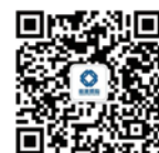
欢迎关注杭萧钢构微信

总部地址: 杭州中河中路258号 瑞丰国际商务大厦3-7楼 电话: 0571-87246788 传真: 0571-87240484 0571-87247920 网址: http://www.hxss.com.cn 邮箱: jtxcb@hxss.com.cn 邮编: 310003